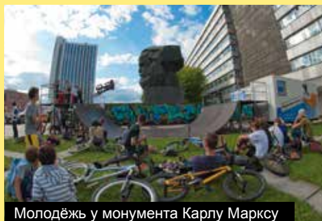
Молодёжь у монумента Карлу Марксу