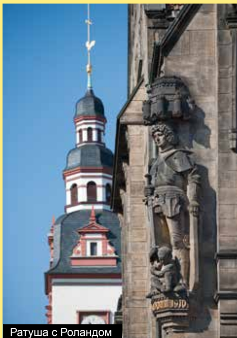
Ратуша с Роландом