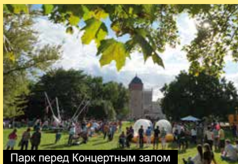
Парк перед Концертным залом