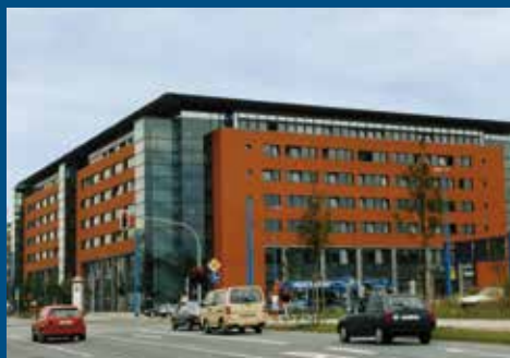
Moritzhof, Bahnhofstraße 53, 09111 Chemnitz

➤ Stadt Chemnitz – Sozialamt Abteilung Migration, Integration, Wohnen ➤ Stadt Chemnitz – Ausländerbeauftragte