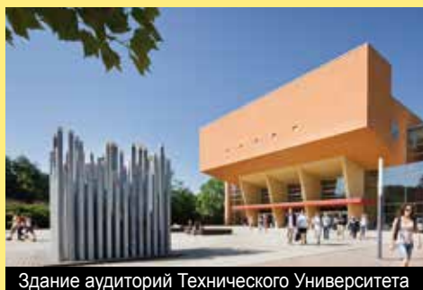
Здание аудиторий Технического Университета