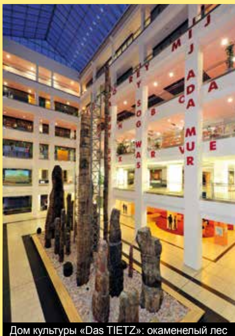
Дом культуры «Das TIETZ»: окаменный лес