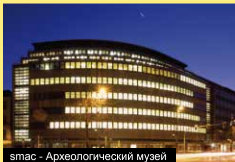
smas - Археологический музей