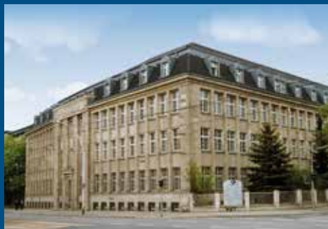
Annaberger Straße 93, 09120 Chemnitz

➤ Stadt Chemnitz – Bürgeramt, Meldebehörde