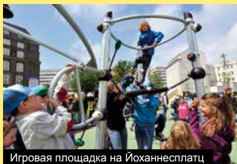
Игровая площадка на Йоханнесплатц