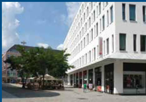
Bürgerhaus Am Wall Düsseldorfer Platz 1, 09111 Chemnitz

Stadt Chemnitz – Sozialamt Annaberger Straße 93 09120 Chemnitz Тел.: 0371 488-5001 факс: 0371 488-5099 Email: sozialamt@stadt-chemnitz.de www.chemnitz.de